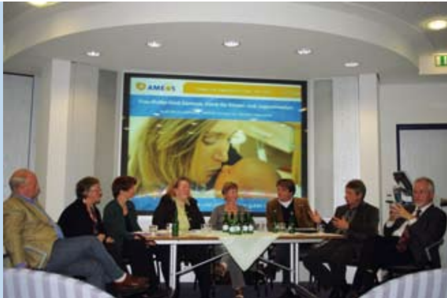
Fortbildung in der Rotunde