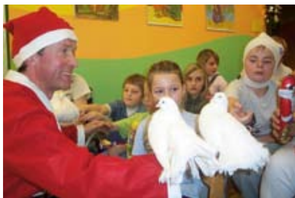
Nikolaus in der Kinderklinik

In unserer Region haben sich sowohl Fallzahlentwicklung, Vorhaltedichte und Leistungsumfang sowie apparative Ausstattung und Umweltvoraussetzungen wie z. B. Verkehrsanbindung günstig gestaltet. Für überregionale Versorgung spricht das Vorhalten mehrerer Fachgebiete einschließlich Schwerpunktkompetenz über die Basisversorgung hinaus. Besonders günstig haben sich die Kooperationen mit den universitären Einrichtungen wie der Kinderklinik der Otto-von-Guericke-Universität Magdeburg und dem Herzzentrum Leipzig gestaltet. Auch pflegen wir enge Zusammenarbeit mit den Nachbarkrankenhäusern wie dem AMEOS Klinikum für Psychiatrie und Neurologie Haldensleben, dem Harz-Klinikum Wernigerode-Blankenburg GmbH, dem Klinikum Dorothea Christiane Erleben in Quedlinburg, den Kreiskliniken Aschersleben-Staßfurt sowie dem MEDIGREIF Bördekrankenhaus Oschersleben. So halten wir neben der ausgewiesenen Schwerpunktkompetenz Neonatologie die 24-stündige Facharztkompetenz „Chirurgie am Kinde ohne Neonatalchirurgie“ vor. Die 24-stündige Präsenzpflcht durch Fachschwestern für Kinderintensivmedizin sowie Kinderkrankenschwestern ist dabei ebenfalls gewährleistet.