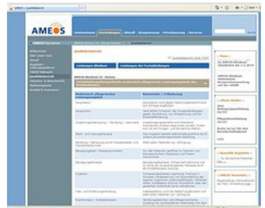
Daten der SQR direkt online abrufbar